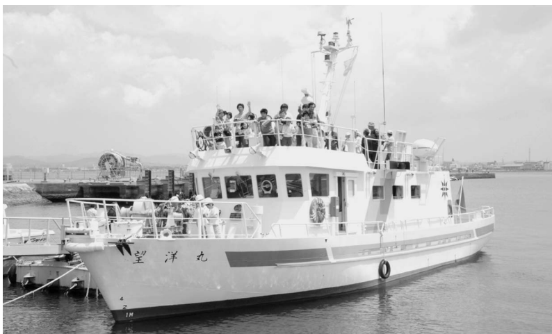
『たてやま海まちフェスタ2007』