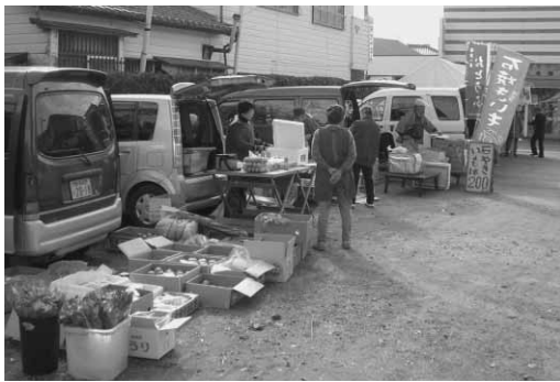
昭和通りの『お楽しみ露天市』

また、旧十字屋前の通りを 会場に、毎月第2・第4日曜 日の午前9時から正午まで開 催されている「さとみ軽トラ 市」も市民から好評であるこ とから、館山銀座商店街(振