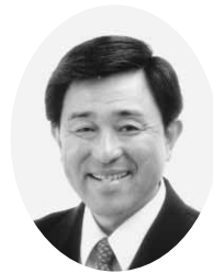
館山市長 金丸 謙一

新年明けましておめでとうございませう。高橋会頭をはじめ館山商工会議所の皆様には、爽やかな新春をお迎えのこととお慶び申し上げます。