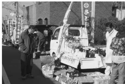
旧十字屋前通りの『さとみ軽トラ市』

では「お楽しみ露天市」や 「さとみ軽トラ市」と周辺商 店の連携を取り、より一層の 街の活性化を図りたいと考え ている。