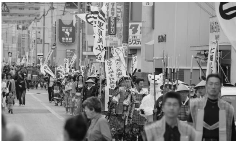
第27回 南総里見まつり