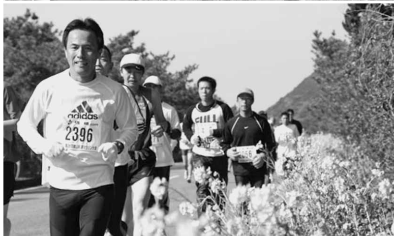
第28回館山若潮マラソン大会・SL南房総号