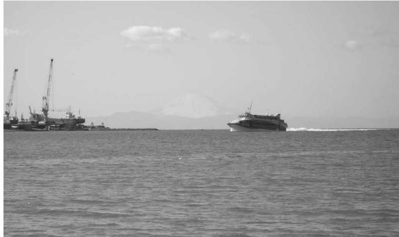
館山～大島～下田を結ぶ高速ジェット船

剣道部 第17回全国高等学校剣道選抜大会出場 (3月27・28日開催 於:愛知県春日井市総合体育館)