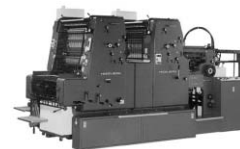
ハイデルベルグ2色両面機 (MOZP)