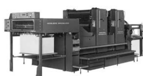
ハイデルベルグ2色両面機 (102ZP)