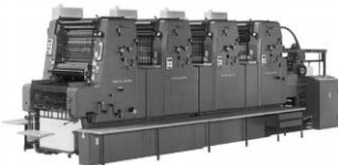
ハイデルベルグ4色機 (MOV)