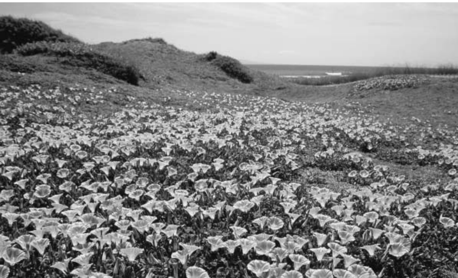
館山観光写真コンクール入選作品『浜の貴婦人』

●昭和51年7月10日 第3種郵便物認可 ●平成20年6月10日発行 (毎月1回10日発行) 第486号 ●発行所/館山商工会議所 ●編集発行責任者/専務理事 山本佳幸 ●〒294-0047 千葉県館山市八幡 821 ●TEL 0470-22-8330 FAX 0470-23-4011 ●印刷所/株式会社 集賢舎 ●定価 1部 20円 (購読料は会費に含まれています)