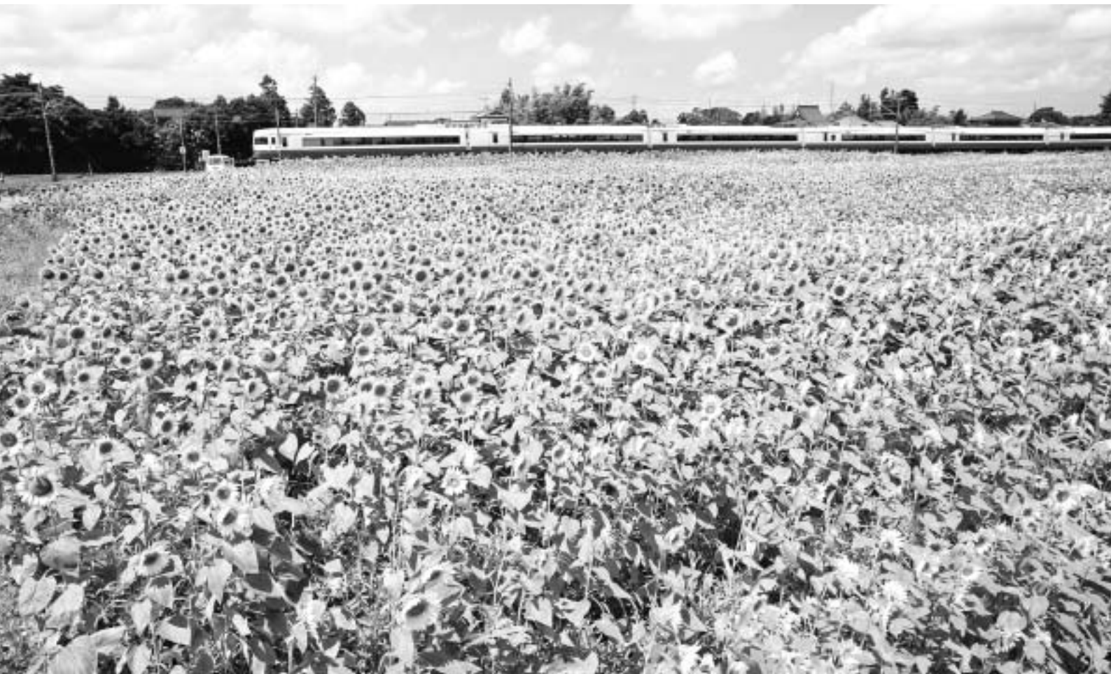
館山観光写真コンクール入選作品『ヒマワリ畑』

●昭和51年7月10日 第3種郵便物認可 ●平成20年7月10日発行 (毎月1回10日発行) 第487号 ●発行所/館山商工会議所 ●編集発行責任者/専務理事 山本佳幸 ●〒294-0047 千葉県館山市八幡821 ●TEL 0470-22-8330 FAX 0470-23-4011 ●印刷所/株式会社 集賢舎 ●定価1部20円 (購読料は会費に含まれています)