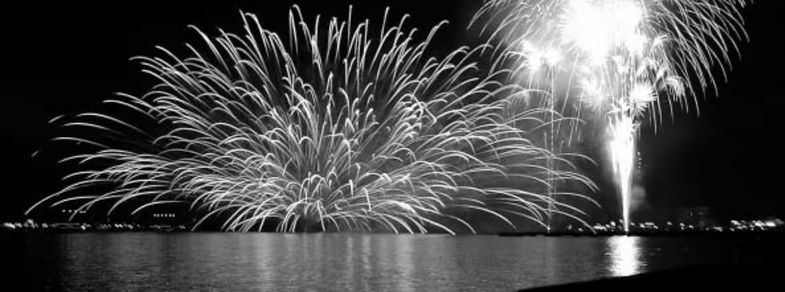
第45回館山観光まつり 館山湾花火大会