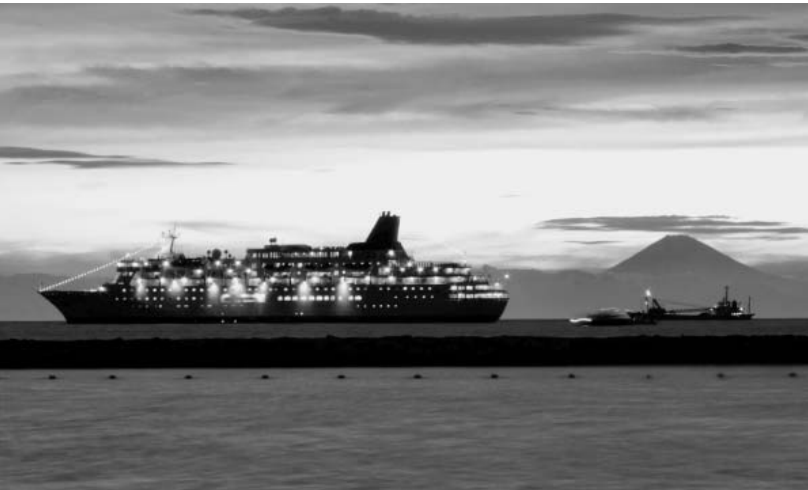
館山写真コンクール入賞作品「花火を待つ富士とふじ丸」

●昭和51年7月10日 第3種郵便物認可 ●平成20年9月10日発行 (毎月1回10日発行) 第489号 ●発行所/館山商工会議所 ●編集発行責任者/専務理事 山本佳幸 ●〒294-0047 千葉県館山市八幡 821 ●TEL 0470-22-8330 FAX 0470-23-4011 ●印刷所/株式会社 集賢舎 ●定価 1部 20円 (購読料は会費に含まれています)