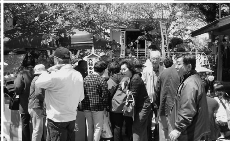
『第8回しゃくやくまつり』