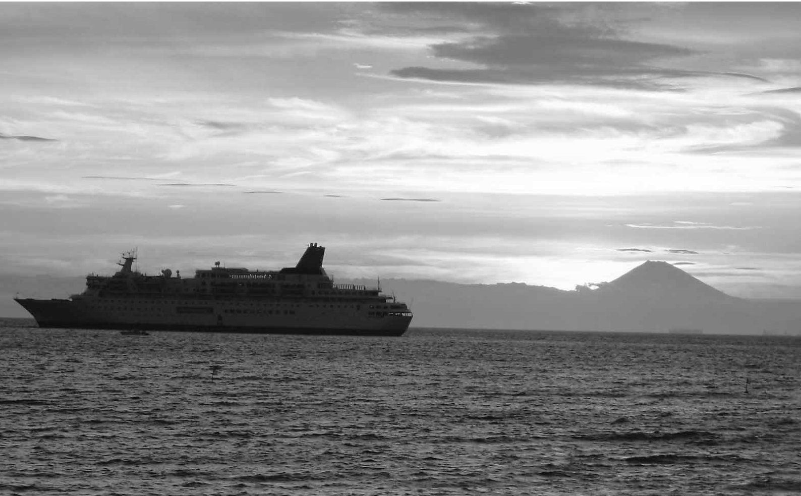
館山写真コンクール入賞作品『鏡ヶ浦夏の夕景』

●昭和51年7月10日第3種郵便物認可●平成21年9月10日発行(毎月1回10日発行)第501号●発行所/館山商工会議所●編集発行責任者/専務理事 山本佳幸●〒294-0047 千葉県館山市八幡 821 ●TEL 0470-22-8330 FAX 0470-23-4011 ●印刷所/株式会社集賢舎●定価1部20円(購読料は会費に含まれています)