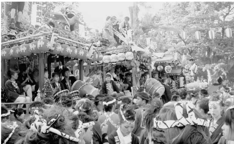
千葉県指定無形民俗文化財「やわたんまち」