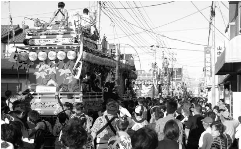
【第28回南総里見まつり】