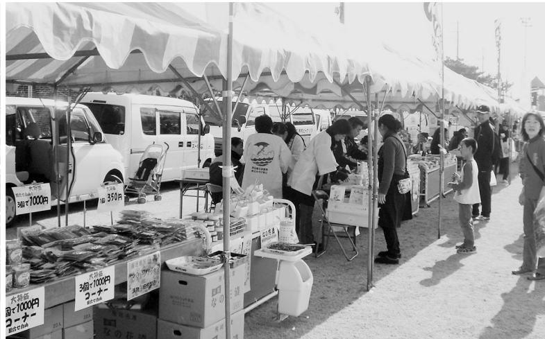
第30回館山若潮マラソン大会